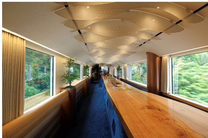
IFOOのメンバーとしてデザインを担当したJR九州の観光列車「かんばち・いちろく」